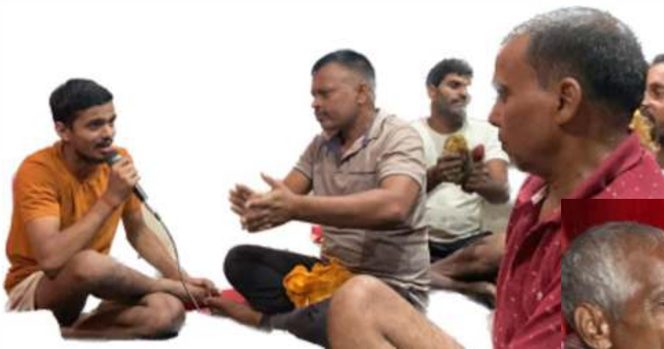
Cultural Activity at Village Shahpur, Bhalua II, Bela Gaya