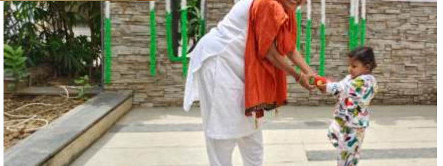
Gift Distribution to Children