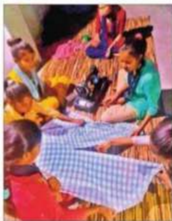
थैला व मास्क बनाने का प्रशिक्षण प्राप्त करती महिलाएं।

सोसाइटी फॉर इंप्रूवमेंट की ओर से कस्तूरबा गांधी सेंटर फॉर ट्रेनिंग व प्रोजेक्शन की शुरुआत की गयी है। इसके तहत गांवों की महिलाओं को स्वावलंबी और सशक्त करने के लिए सिलाई का प्रशिक्षण दिया जा रहा है। गया जिले के बेलगंज प्रखंड के शाहपुर में इसकी शुरुआत की गयी है। इसका मकसद महिलाओं को आत्मनिर्भर बना कर रोजगार से जोड़ना है। संस्था से यहां नौ गांवों से कुल 800 महिलाएं व युवतियां जुड़ी हुई हैं, जो दो शिफ्टों में काम कर रही हैं। ये सभी महिलाएं अभी कपड़े के थैले और मास्क बनाने का काम कर रही हैं।