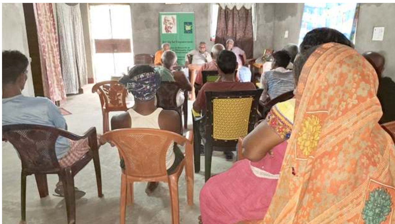
ढ-Grow In For Togetherness – A Reskilling – Upskilling Centre