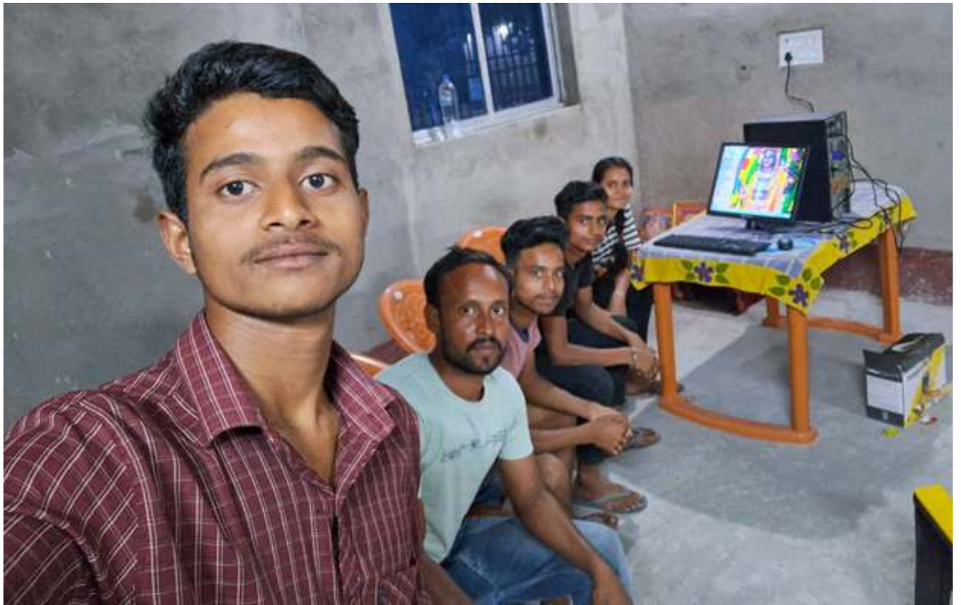
Kasturba Gandhi Advance Learning Centre- Evening Skill Classes