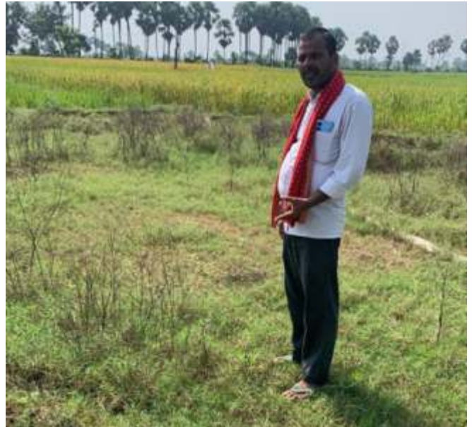
Plantation Activity at Village Shahpur, Bhalua II, Bela Gaya