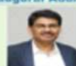
Prof. Krishna Raj Institute for social and economic change (ISEC) Bangalore