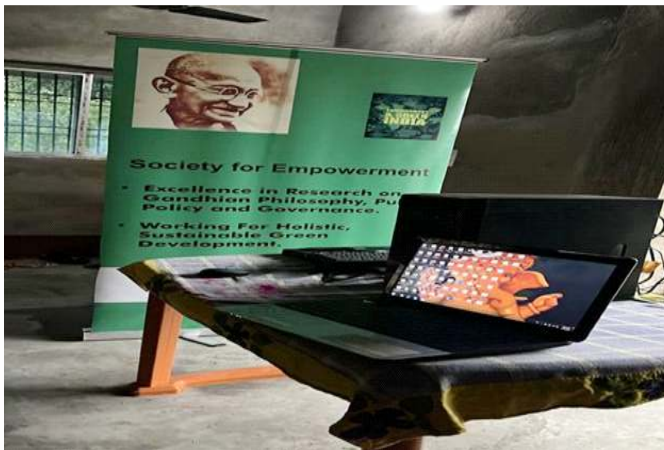
ढ-Grow In For Togetherness – A Reskilling – Upskilling Centre