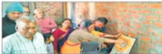
बेलागंज के शाहपुर में बापू की भव्यजतिनी होती थी।

राय, प्रधन संवाददाता। स्वतंत्रता संग्राम के दौरान 103 साल पहले महात्मा गांधी बेलागंज के शाहपुर गांव पहुंचे थे। योमवार को शाहपुर गांव में गांधी जी के आगमन को खाद करने हुए खेसहटी फॉर डेसावरमेंट ने कार्यक्रम आयोजित किया। गांधी जी के चित्र पर भाल्पारण कर लोगों ने उन्हें खाद किया।