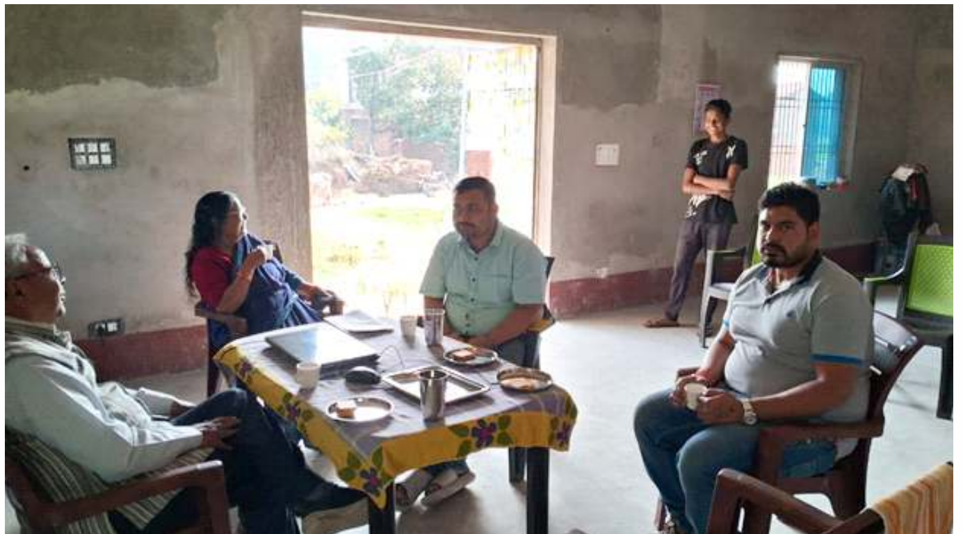
Meeting with CUREOFINE TEAM at GIFT Centre