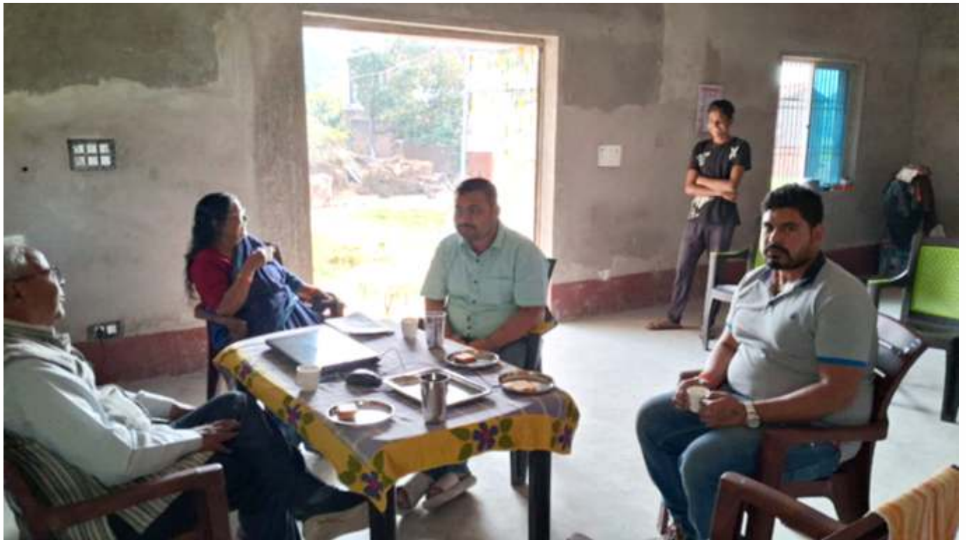
Meeting with CUREOFINE TEAM at GIFT Centre