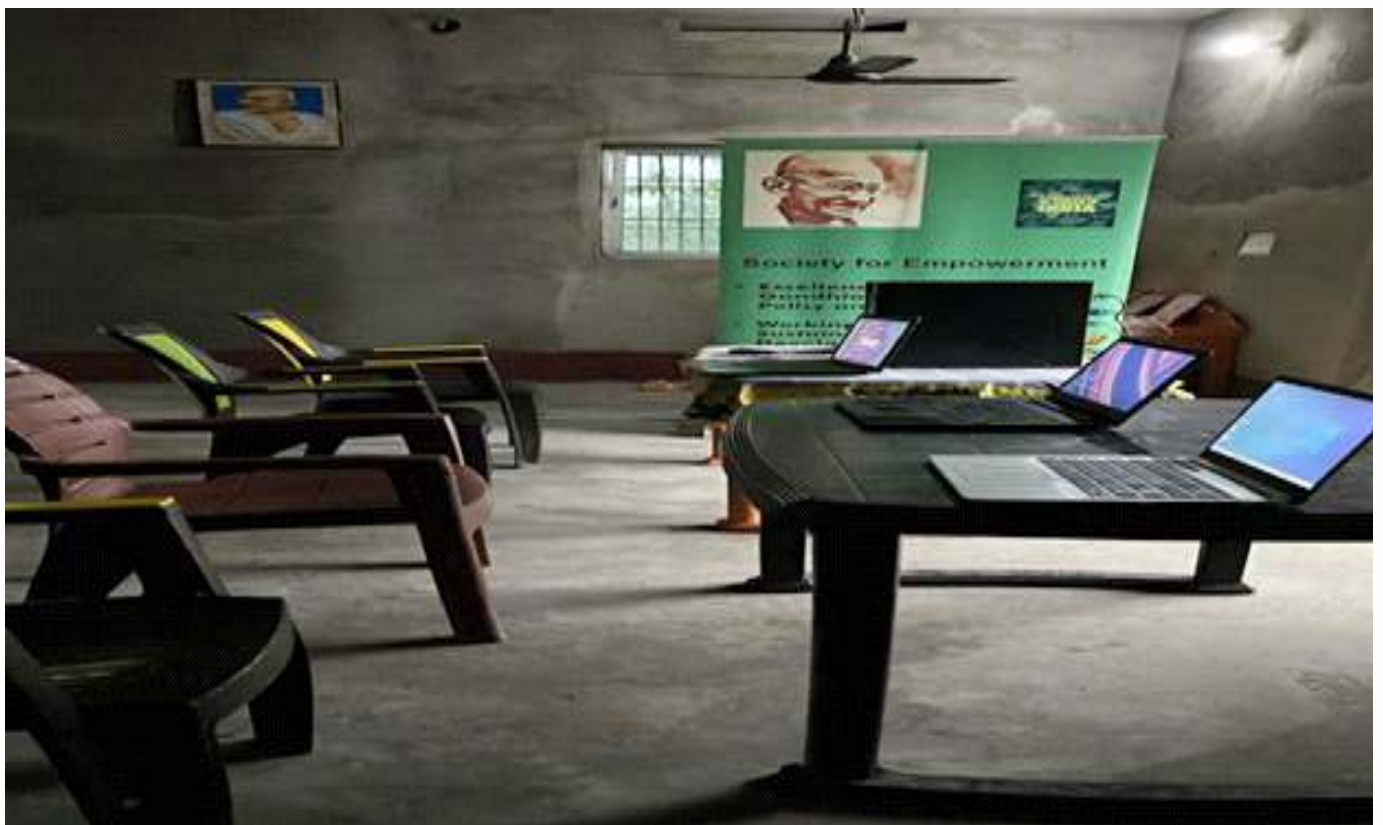
ॢ-Grow In For Togetherness – A Reskilling – Upskilling Centre